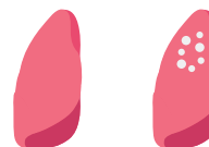
Sain Abcès pulmonaires dus à la rhodococcose

En autopsie, la forme respiratoire avec des abcès pulmonaires est la plus fréquente.